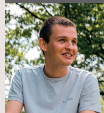
Buchautor: Marian Grau